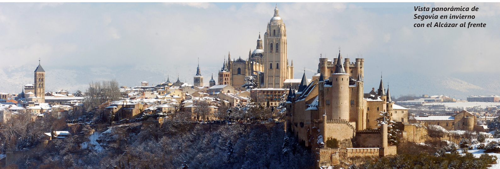
Vista panorámica de Segovia en invierno con el Alcázar al frente

1966年、セゴビア生まれ。マドリッド・コンプルテンセ大学卒業（英語文献学）。ニューヨーク・ロンチェスター大学修士・博士課程修了（言語と認知脳科学博士）。1996年から神戸市外国語大学で教鞭をとり現在同大学教授。研究分野は言語学、言語処理、第二言語習得法に及ぶ。大学院生のための奨学金を通して文科省が助成する日本語話者のスペイン語学習法に関する調査チームを指揮。著書及び国際的専門誌への発表論文多数。スペイン語、英語、日本語で社会的テーマに関わる講演やコラムの執筆も行う。