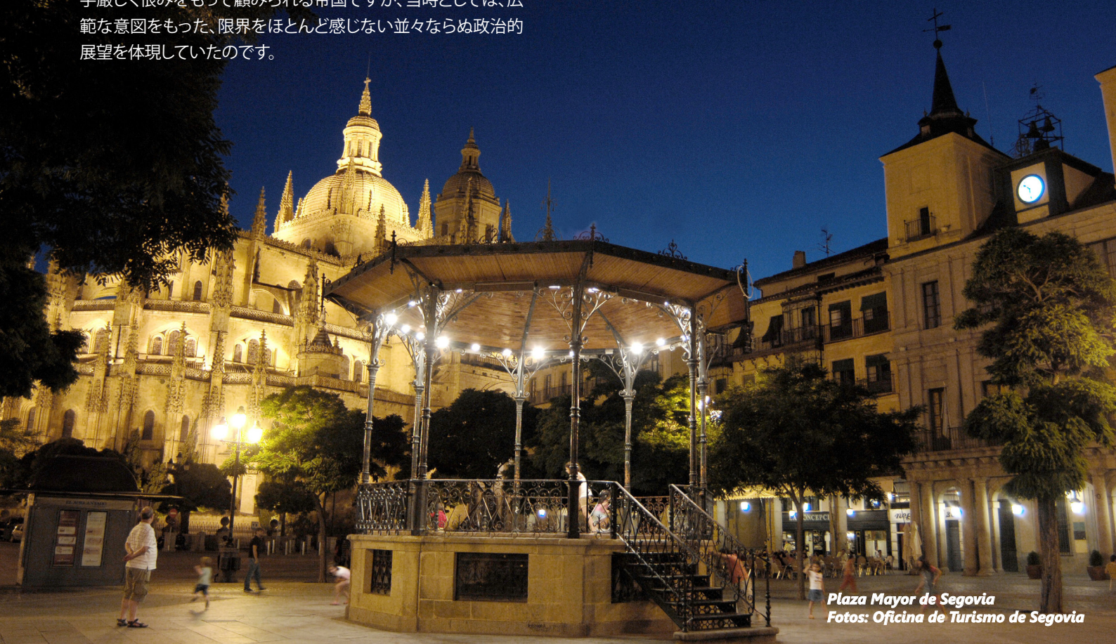
Plaza Mayor de Segovia